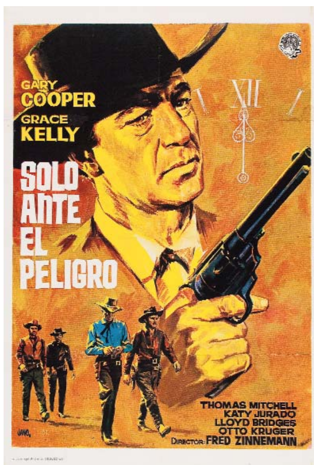
Acción: finales del siglo XIX (Hadleyville, ¿?, EEUU). Cartel español