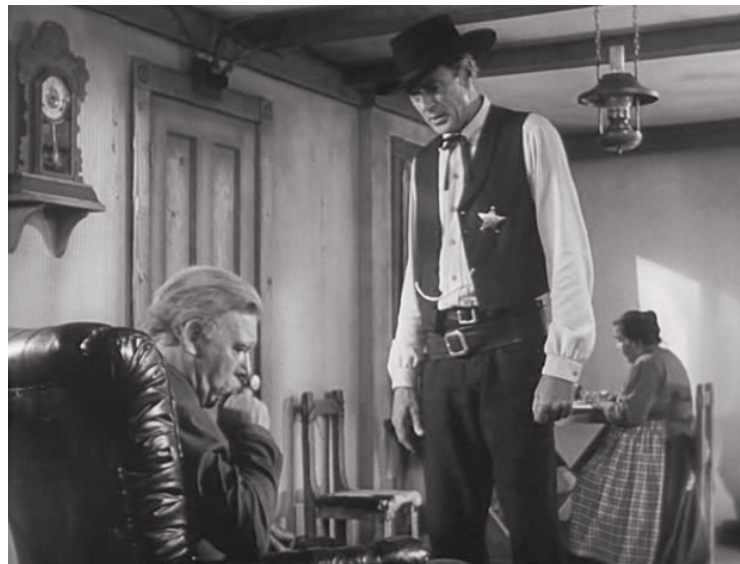
...padece una artritis reumatoide...