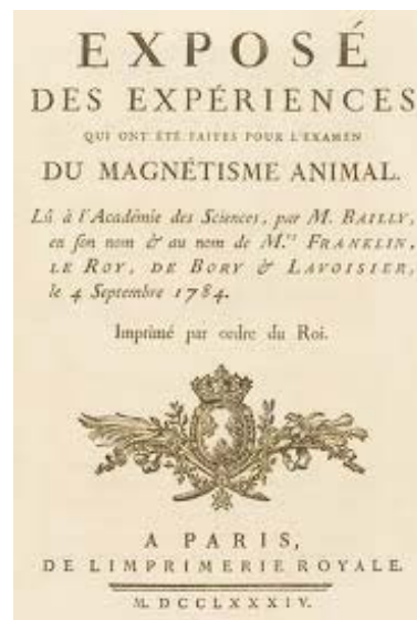
Foto 2: portada del informe ordenado por Luis XVI sobre las prácticas médicas de Franz Anton.

Si bien en 1781, publicó: Précis historique des faits relatifs au magnétisme animal , en 1784, Luis XVI, menos atraído que María Antonieta por las prácticas mesmerianas, formó una Comisión Real con cuatro miembros de la Facultad de Medicina y cinco, de la Academia Real de Ciencias (entre ellos: el químico Antoine-Laurent de Lavoisier, el astrónomo Jean Sylvain Bailly, el ministro plenipotenciario y científico estadounidense Benjamin Franklin y el médico Joseph Ignace Guillotin – paradójicamente propulsor del aparato que decapitó entre 1793 y 1794 al rey, a Bailly y a Lavoisier d –), a quienes ordenó analizar la falsedad o legitimidad de aquellas prácticas. Esta comisión realizó un conjunto de experimentos al efecto y concluyó que, sumado a la inexistencia de evidencias concretas sobre el magnetismo animal, los beneficios de la terapia estudiada residían en la imaginación y auto-sugestión de los pacientes (foto 2).