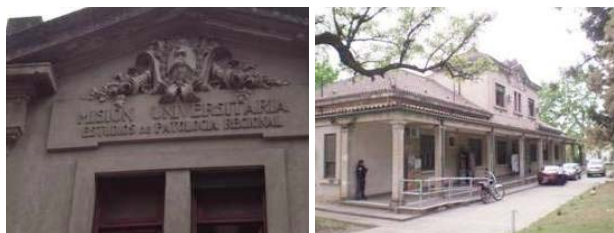
Foto 5: edificio de la Misión de Estudios de Patología Regional. Actualmente sede del Rectorado de la Universidad Nacional de Jujuy, Argentina.

“El tema de la Enfermedad de Chagas ya fue abordado en el año 1995, en la película «Casas de Fuego», dirigida por Juan Bautista Stagnaro y sobre la cual se escribió un artículo en esta revista 1 . Se trata, en este caso, de una historia novelada, que narra episodios reales de la vida del Dr. Salvador Mazza intercalados con sucesos de ficción. Además, narra las situaciones dramáticas que viven los pobladores de las áreas rurales de Argentina frente al flagelo de la Enfermedad de Chagas. El Director se detiene en el relato de sus ardorosos debates en la Universidad de Buenos Aires con motivo de sus investigaciones sobre esta endemia, así como la creación de la MEPRA en San Salvador de Jujuy, en el noroeste del país (foto 5) siguiendo el consejo del Premio Nobel Charles Nicolle. En el final de la película se muestra metafóricamente la quema de los ranchos como una forma de eliminar a las vinchucas. Es una película que recibió numerosas distinciones en festivales de cine Internacionales, tanto Latinoamericanos, como europeos”.