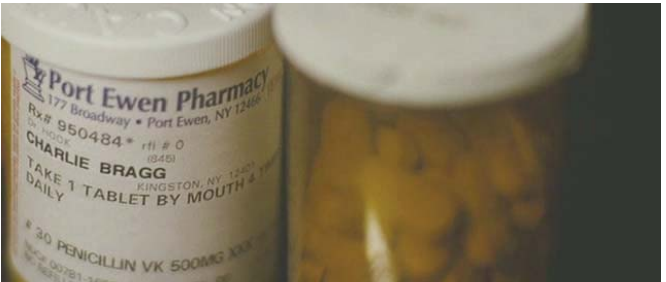
Tratamiento: penicilina V potásica.