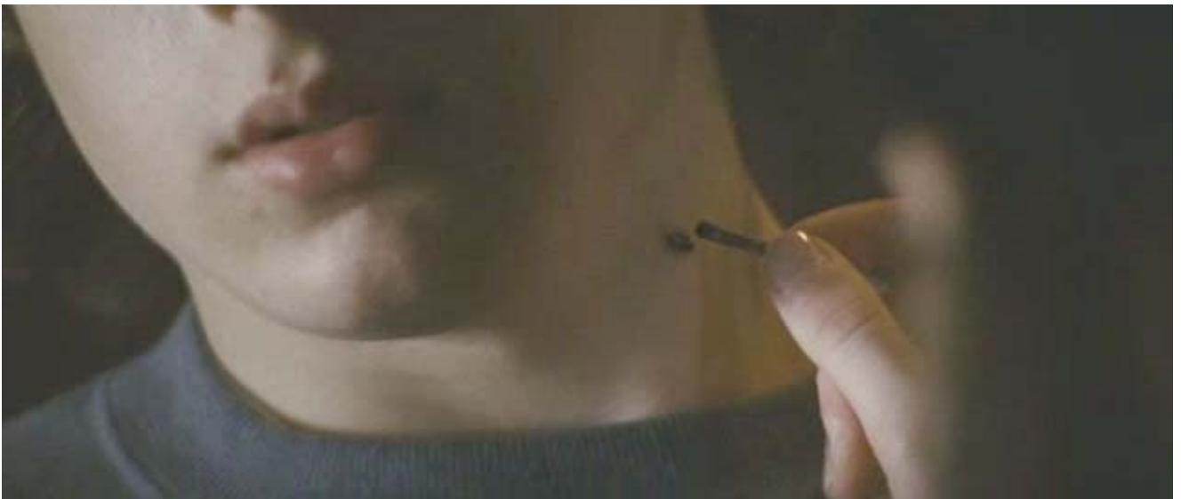
Prevención: extracción de la garrapata con unas pinzas puntiagudas, no usar otros procedimientos como un fósforo caliente.