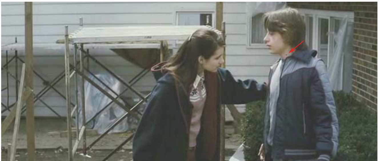
Trasmisión: picadura de Ixodes scapularis (garrapata de pata negra o del ciervo).