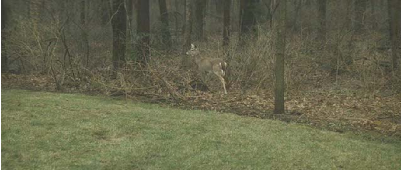
El ciervo de cola blanca ( Odocoileus virginianus ) esencial en el ciclo de la garrapata.