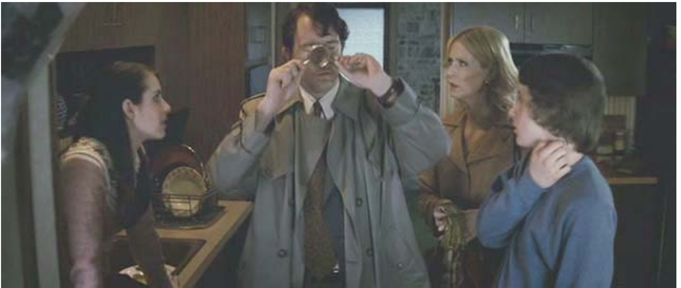
Caracterización de la garrapata.