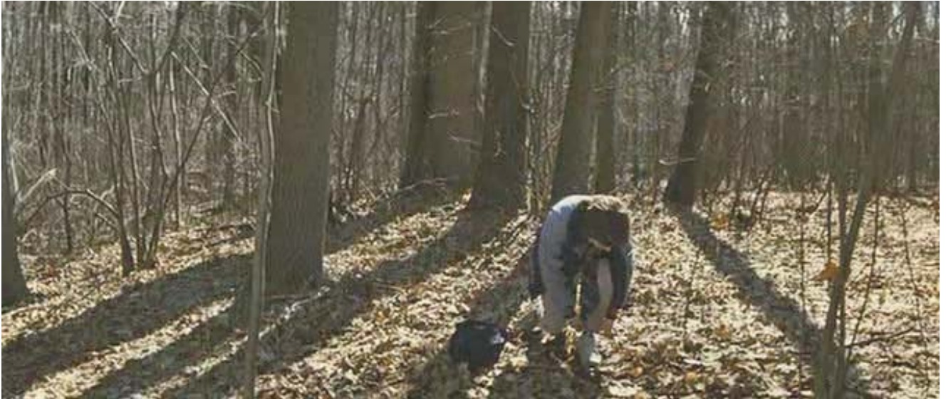
Prevención: barrera mecánica, sellado del pantalón con el calzado.