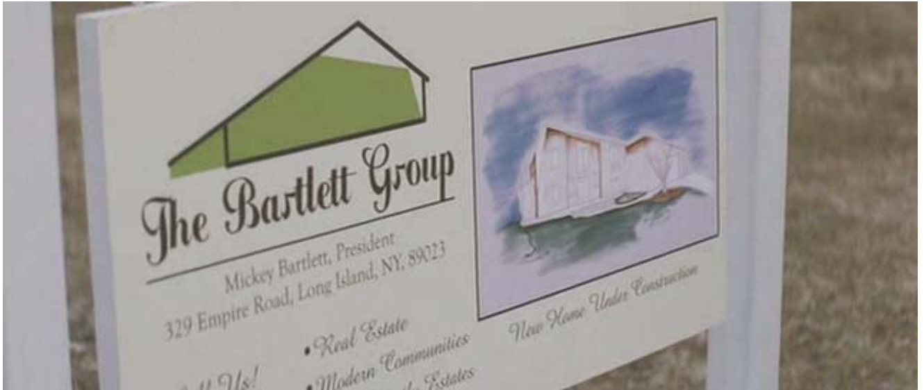
Distribución geográfica: importante en el noroeste de Estados Unidos.