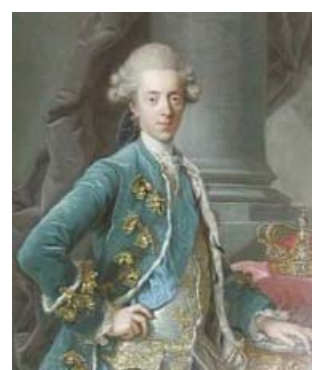
Foto 1. El triángulo amoroso real: Johann Friedrich Struensee, Reina Caroline Matilda de Gran Bretaña y Rey Christian VII de Dinamarca y Noruega.