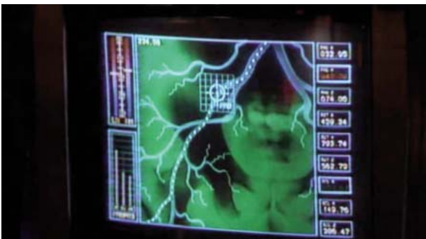
Foto 5. Pantalla del ordenador de a bordo de la nave, en la que se indica la ruta a seguir.

visual con el exterior, a través de los ojos del individuo inyectado. Este aspecto, da origen a una amplia y risoria discusión, por la forma de llegar al sistema óptico desde donde se encuentra tras su inyección.