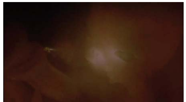
Foto 9. Embrión que visualiza Tuck desde la nave, ante su sorpresa.