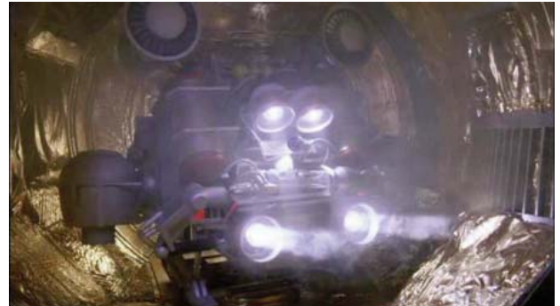
Foto 1. Nave a miniaturizar para navegar por el interior del organismo.

(Foto 2). Este aspecto guarda una gran similitud con la película Viaje Alucinante, de la que toma bastante referencia sobre el recorrido por el interior del organismo (Juanes, 2013).