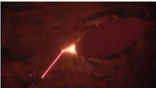
Foto 4. Imagen del láser haciendo una incisión en la pared de un vaso sanguíneo para introducirse por el torrente circulatorio.