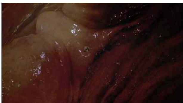
Foto 10. Imagen del esófago por donde avanza la nave hasta llegar al estómago.

En su navegación por el aparato digestivo, se ve como camina por el esófago (Foto 10) y llega al estómago, donde le descubre algo patológico en su interior (¿una úlcera gástrica?, ¿una tumoración?)