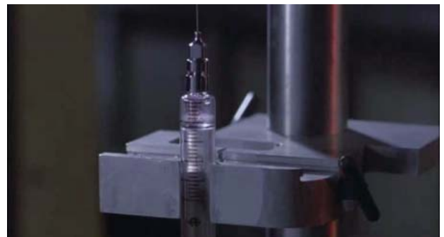
Foto 2. Jeringa donde es transportada la cápsula miniaturizada para su inyección.

Inyectado en el cuerpo de un ser humano, la cápsula pilotada por Tuck Pendelton es programada para alcanzar el objetivo: llegar al nervio óptico. Lo primero que se encuentra, tras la inyección es con el tejido celular subcutáneo, apareciendo en la imagen células grasas, bien simuladas, propias del tejido adiposo (Foto 3). Para entrar en la corriente sanguínea, utiliza un laser sobre la pared del vaso, para introducirse por el agujero provocado, con la consiguiente hemorragia que desencadena en el sujeto (Foto 4).