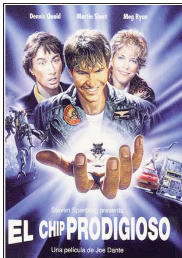
Cartel de la versión española.