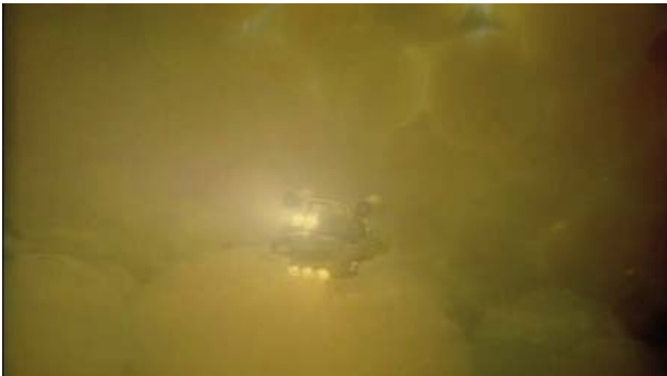
Foto 3. Imagen de la cápsula navegando por el tejido adiposo.