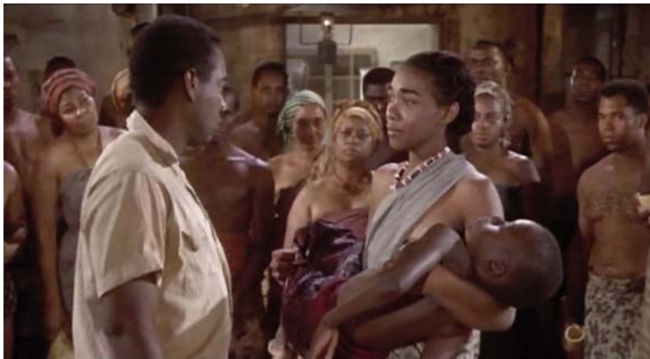
Enfermedad del sueño: coma (“Puede curar mademoiselle a mi hijo del sueño que nunca acaba”).