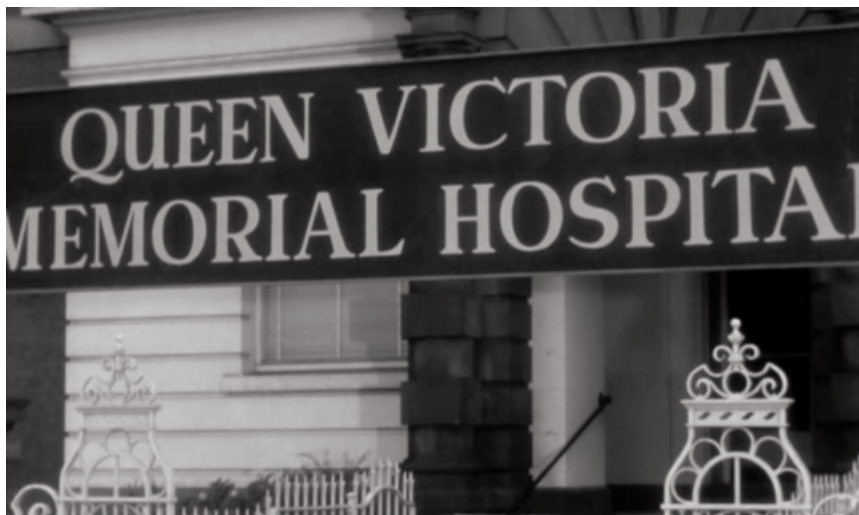
Hospital responsable de la entrega de los somníferos a toda la población.