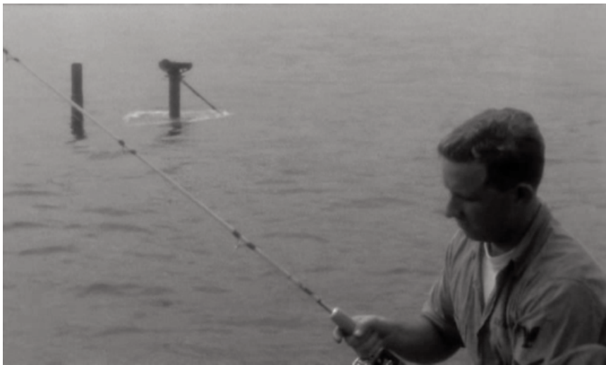
Un marino de la tripulación pescando al aire libre en la bahía de San Francisco, sin protección y totalmente contaminada con la nube radioactiva.