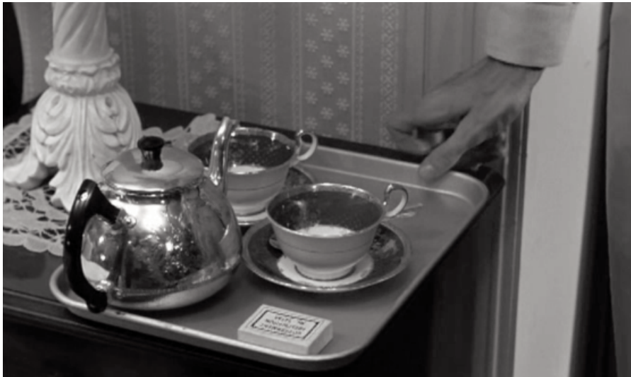
Ingestión de los somníferos con té de una familia con su bebé.