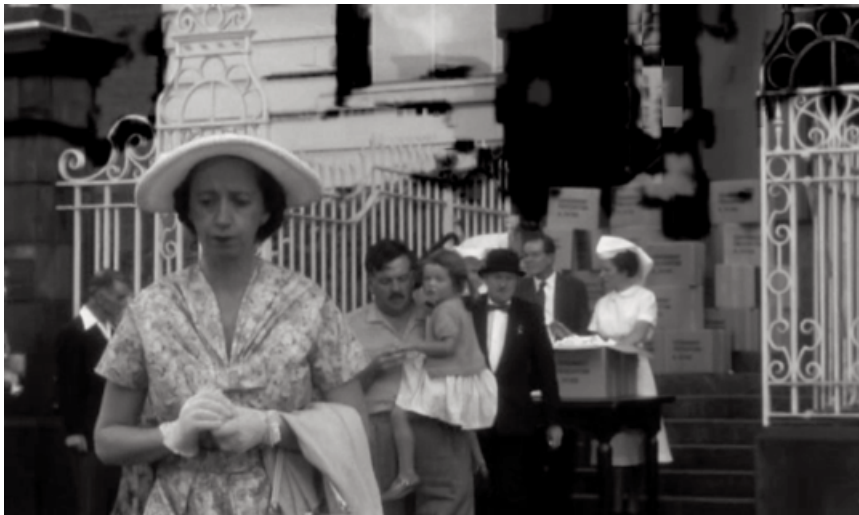
La gente haciendo cola para recoger la cajita de los somníferos.