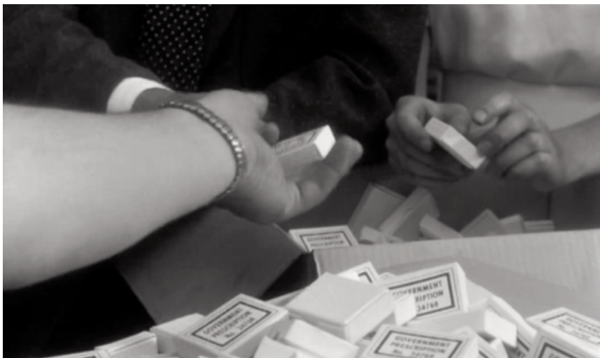
Entrega de los somníferos según los miembros de cada familia.