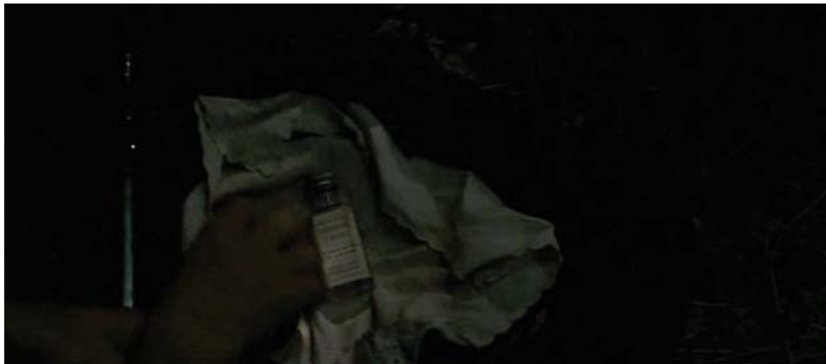
La quinina fue el tratamiento fundamental, muchas veces conseguida en el mercado negro.

María García Moro 1 , Enrique García Sánchez 2,3,4 , José Elías García Sánchez 2,3,4