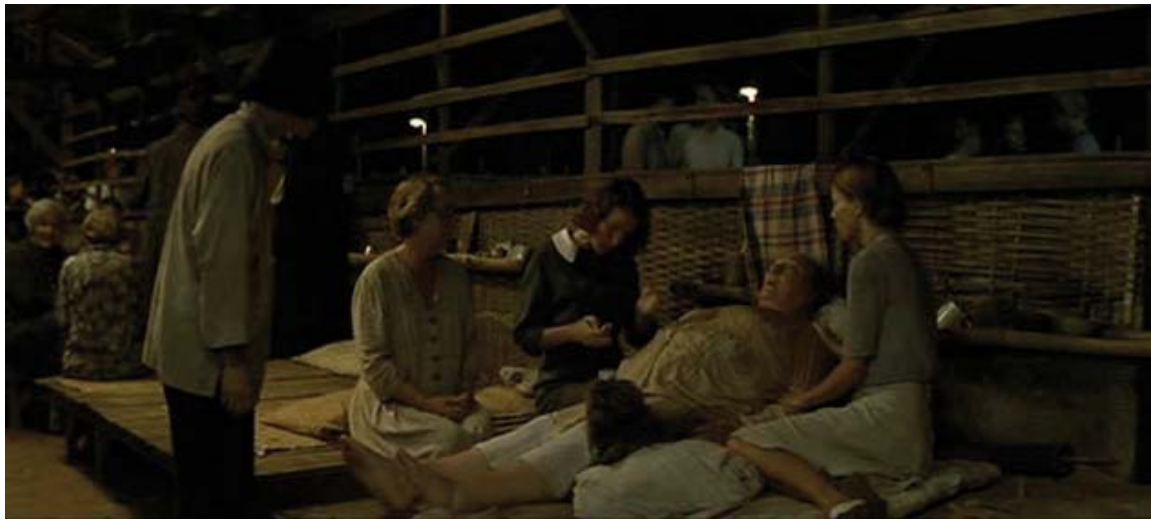
Mal estado general.