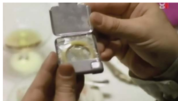
Foto 4. Mechero-preservativo que regala la protagonista a su pareja.