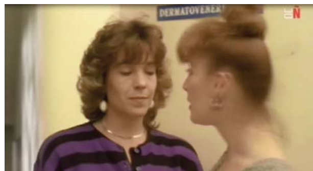
Foto 1. Dermatovenéreas aparece en la puerta de la consulta.

En la actualidad, la mayor parte de las infecciones de transmisión sexual y en especial el SIDA, son el campo de acción de especialistas en dermatología pero en mayor medida de médicos formados después de esa