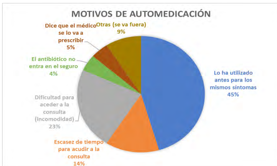
FIGURA 3. Motivos que alegaron los pacientes para recurrir a la automedicación.

En ninguno de los casos de automedicación se dispensó el antibiótico. El 77% de los pacientes se remitieron al médico. El resto de las situaciones se consideraron trastornos menores, para los que se aconsejaron medidas higiénico-dietéticas o se indicaron medicamentos para paliar los síntomas como antigripales, bucofaríngeos, analgésicos... que no necesitan receta médica. Aquí fue muy importante nuestra intervención, ya que evitó la utilización inadecuada o innecesaria del antibiótico, lo que es una causa importante en la aparición de resistencias. Esta intervención se centró en explicar al paciente que su trastorno no necesitaba antibiótico y que estos siempre los debía prescribir el médico. Para recalcar esta información, se entregó el tríptico. Los motivos que alegaron los pacientes para recurrir a la automedicación están recogidos en la figura 3.