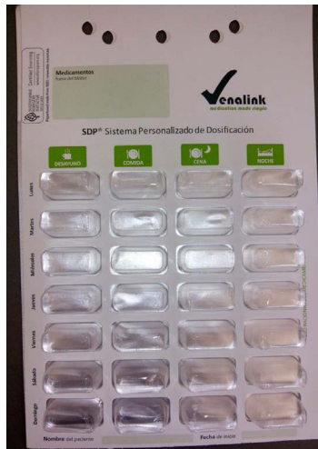
IMAGEN 1: Dispositivo blíster semanal Venalink® para elaboración de SPD.

1. Información al paciente o persona responsable sobre SPD: Se entrega al paciente un folleto informativo con la descripción del SPD y se muestra un blíster de prueba (Imagen 1) y su funcionamiento. A continuación, se explica al paciente la necesidad de disponer de los datos farmacoterapéuticos de forma actualizada, y se asegura la garantía total de confidencialidad por parte del farmacéutico. En este paso habría que informar también del coste mensual del servicio, que durante este estudio se realizó gratuitamente.