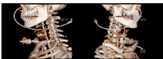
Figura 3: Reconstrucción 3D de TC cervicotorácica de control.

Durante el seguimiento se realizaron controles periódicos con fibroscopia flexible para valorar la posición del estent y la evolución del edema laríngeo. El estent fue retirado a los 14 días tras la intervención. La TC cervicotorácica de control mostró persistencia de la fractura con mínimo desplazamiento y calbagamiento de fragmentos sobre el margen posteroinferior del cartílago tiroides derecho (Figura 3). El paciente fue decanulado tres días después de la extracción del estent tras comprobar la permeabilidad de la luz laríngea y la movilidad glótica.