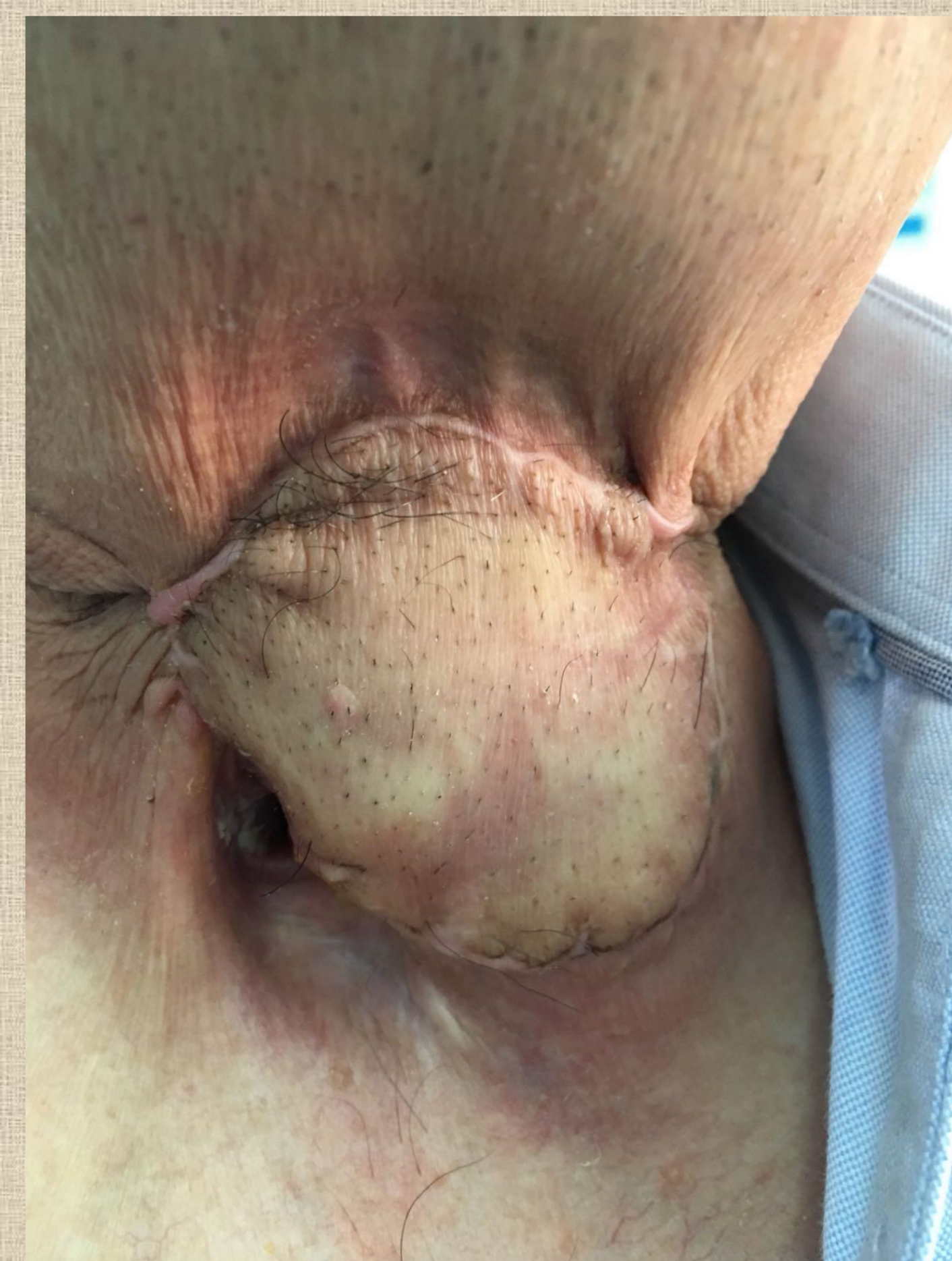
Figura 6: Zona cervical anterior de nuestro paciente en la actualidad.