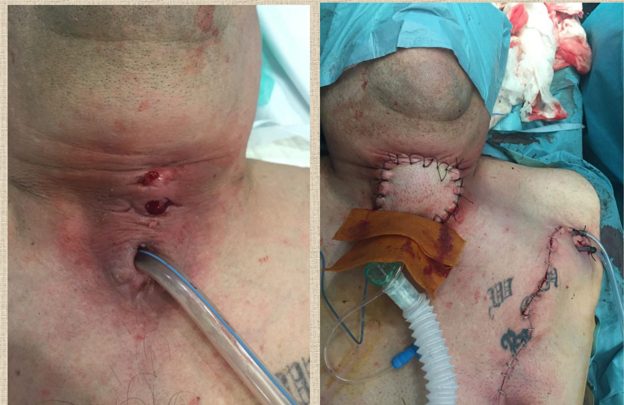
Figura 1 (izquierda): Radionecrosis cervical anterior. Figura 2 (derecha): Colgajo pectoral mayor izquierdo tras exéresis de radionecrosis y de trayecto fistuloso a nivel del cartílago tiroides.

La actinomicosis laríngea es una infección de muy difícil diagnóstico y en muchas ocasiones se confunde con un proceso neoplásico, cómo se describe en nuestro caso. Debemos diagnosticarlo mediante biopsia y estudios microbiológicos . El tratamiento para conseguir el éxito en estos casos consiste en tratamiento antibiótico adecuado y en algunas ocasiones requiere la exéresis de trayectos fistulosos o el drenaje de abscesos , con lo que se consiguen muy buenos resultados habitualmente.