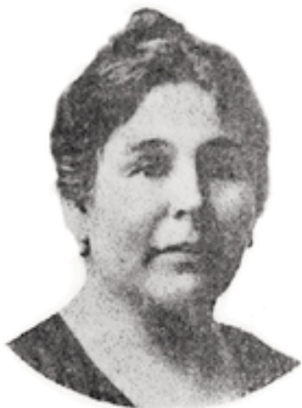
Foto 2: Elvira Rawson Guiñazú (1867 -1954).

Elvira Rawson Guiñazú , nacida en Buenos Aires en 1864 (foto 2), decidió ingresar en la Facultad de Medicina de la Universidad de Buenos Aires. Sin apoyo familiar alguno, ya que la oposición de tal núcleo fue terminante, se empleó como maestra en una escuela de Barrio Norte, aprobó nueve asignaturas de equivalencia para acceder a la Facultad, fue la única mujer entre 84 hombres en el primer curso, y la segunda profesional graduada después de Cecilia Grierson, en 1892, con la tesis: "Apuntes sobre la higiene en la mujer". En 1890, participó activamente en la Revolución del Parque, insurrección cívico-militar producida el 26 de julio de 1890 y dirigida por la recién constituida Unión Cívica, liderada, entre otros, por Leandro Alem. Durante esa jornada, integró con médicos, todos adherentes como ella a tal entidad política, un hospital de campaña en el frente de batalla para atender a los heridos de uno y otro bando en pugna. Posteriormente a la Revolución, la Unión Cívica se fracturó en Unión Cívica Nacional y Unión Cívica Radical. Esta última, en la que