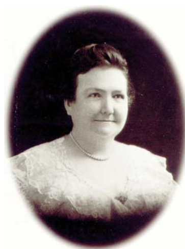
Foto 1: Cecilia Grierson (1859-1934).