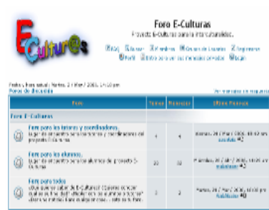
Figura 4. Foro de “E-Culturas”.

El foro (Figura 4) está estructurado de forma abierta a los siguientes usuarios: tutores y coordinadores (del centro educativo), para los alumnos y para otras personas interesadas que quieran acceder a él. Con el foro se pretende compartir experiencias, por iniciativa propia o porque dentro de los módulos se han planteado actividades que invitan a los alumnos a participar de éste.