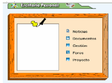
Figura 2. Escritorio del administrador.

Dentro de la sección de usuario registrado la plataforma distingue entre tres tipos de usuarios: administrador, profesor-tutor y alumno. Todos tienen un escritorio personal con distintas opciones. El usuario administrador es el que más control tiene sobre el sistema: las diferentes secciones del proyecto, las guías para los profesores, noticias, gestión y foros. A él tienen acceso el webmaster, la investigadora, el tutor de la tesis y otros profesionales que en su momento han formado parte de este proyecto (Figuras 2 y 3):