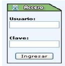
Figura 1. Acceso al área de los módulos.

Dentro de la sección de usuario registrado la plataforma distingue entre tres tipos de usuarios: administrador, profesor-tutor y alumno. Todos tienen un escritorio personal con distintas opciones. El usuario administrador es el que más control tiene sobre el sistema: las diferentes secciones del proyecto, las guías para los profesores, noticias, gestión y foros. A él tienen acceso el webmaster, la investigadora, el tutor de la tesis y otros profesionales que en su momento han formado parte de este proyecto (Figuras 2 y 3):